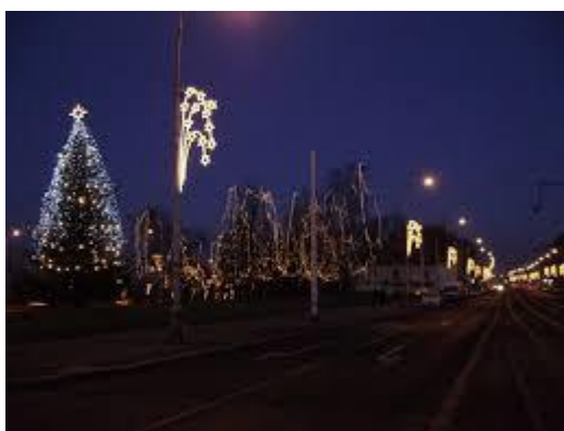
Obrázek 1 - Ukázka slavnostního vánočního osvětlení (ilustrační foto)

Na základě požadavku městysu byla v období vánočních svátků instalována vánoční výzdoba. Náklady na vánoční výzdobu v roce 2022 dosáhli výše 2.347 Kč s DPH.